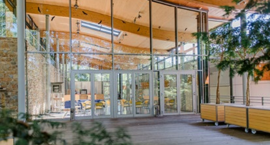
Gedankengebäude der Burg Wernberg Adresse: Schloßberg 10, 92533 Wernberg-Köblitz